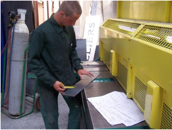
Débit d'une tôle sur cisaille guillotine