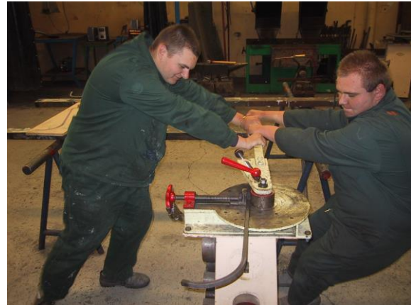
Conformation d'un élément de l'ouvrage sur Rouleuse à profilés