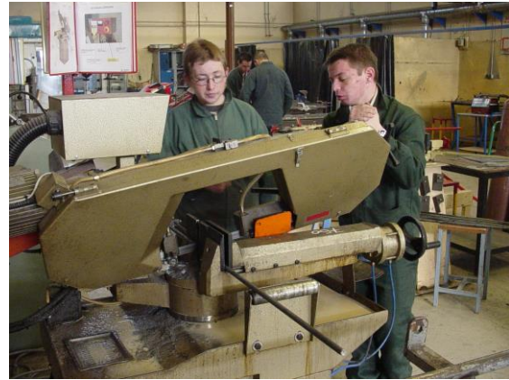
Débit des éléments de l'ouvrage sur scie à ruban