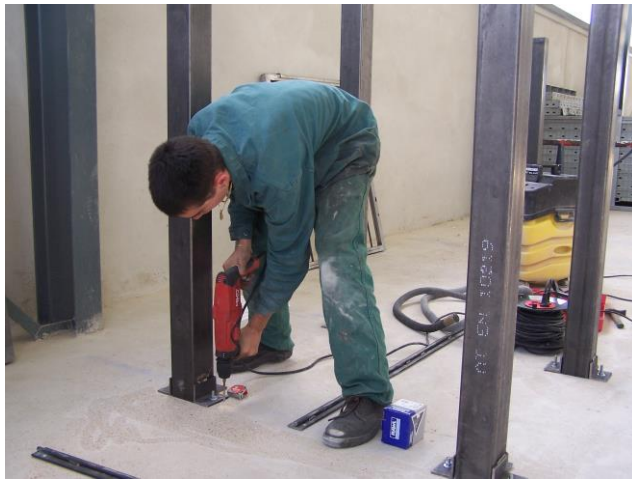
Pose d'un poteau métallique