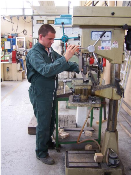
Perçage d'un élément de l'ouvrage sur Perceuse à colonne