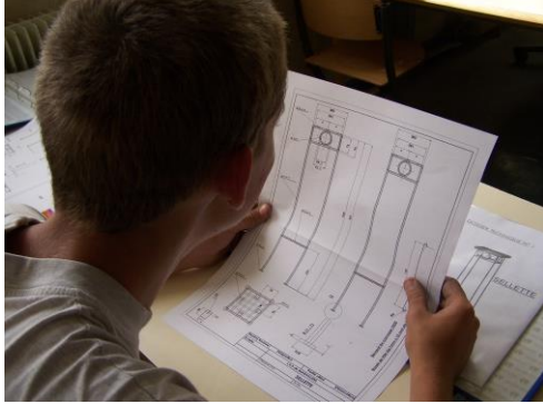
Analyse des plans de fabrication

C101 – Décoder, analyser les consignes, les plans et les documents techniques.