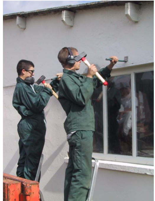
Préparation d'un scellement