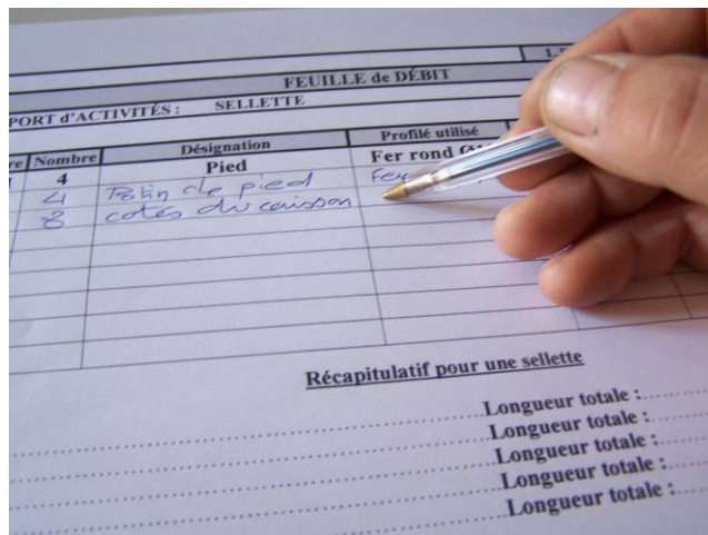
Rédaction d'une feuille de débit

C2.4 – Établir la feuille de débit d'un ouvrage simple ou partie d'ouvrage.